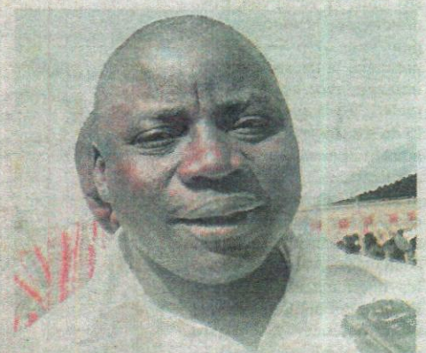
«Le manque de tables-bancs m'a amené à aller vers d'autres établissements pour solliciter des salles de classes afin de permettre à certains élèves de suivre leurs cours», a indiqué le directeur du CEG de Yargatenga.